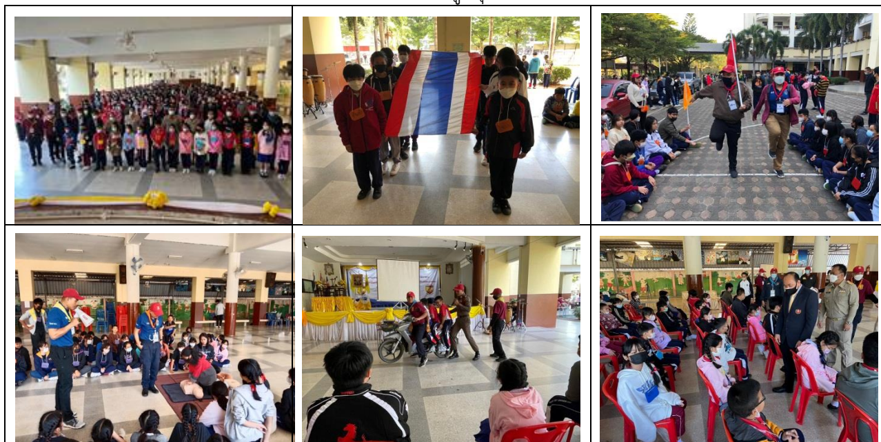
ค่ายทักษะชีวิตสร้างภูมิคุ้มกันยาเสพติด