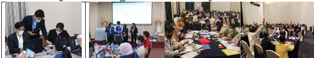
การอบรมเชิงปฏิบัติการการจัดการเรียนรู้ฐานสมรรถนะวิชาคณิตศาสตร์ และฐานสมรรถนะวิชาเทคโนโลยี