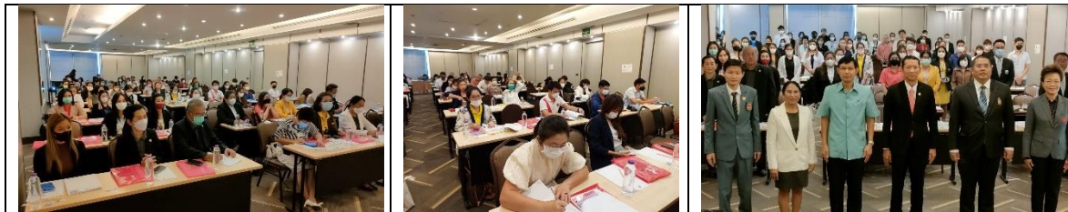
กิจกรรมที่ ๒ ตรวจสอบติดตามการจัดการศึกษาของโรงเรียนนอกระบบ

๑๖. ภาพกิจกรรมที่เกิดขึ้นภายในโครงการ / กิจกรรม (ที่สื่อถึงการดำเนินการสู่ความสำเร็จ จำนวน ๕ ภาพ ขนาด file เท่ากับหรือมากกว่า ๒ MB)