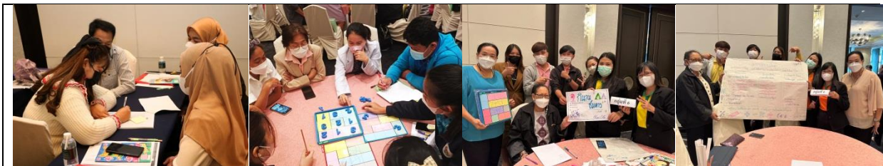
พัฒนารูปแบบการสอนในลักษณะบูรณาการรายวิชาวิทยาศาสตร์คณิตศาสตร์และเทคโนโลยี สำหรับโรงเรียนที่เปิดห้องเรียนพิเศษวิทยาศาสตร์