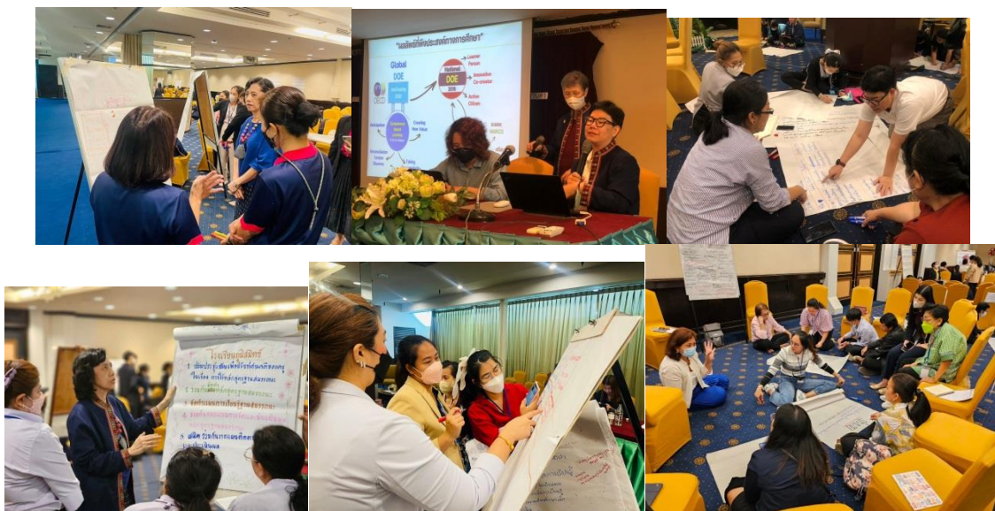
การประชุมชี้แจงการบริหารจัดการโครงสร้างหลักสูตรสถานศึกษา ๘ กลุ่มสาระการเรียนรู้ และ ๑ รายวิชาพื้นฐานประวัติศาสตร์ของโรงเรียนเอกชน

๑๖. ภาพกิจกรรมที่เกิดขึ้นภายในโครงการ / กิจกรรม (ที่สื่อถึงการดำเนินการสู่ความสำเร็จ จำนวน ๕ ภาพ ขนาด file เท่ากับหรือมากกว่า ๒ MB)